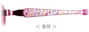
< 音符 >