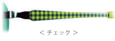
< チェック >