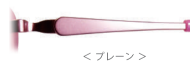
< プレーン >