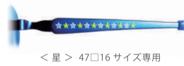
< 星 > 47□16 サイズ専用