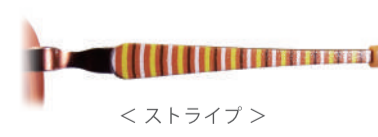
< ストライプ >