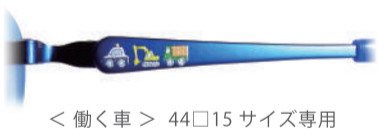
< 働く車 > 44□15 サイズ専用