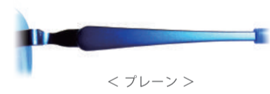
< プレーン >